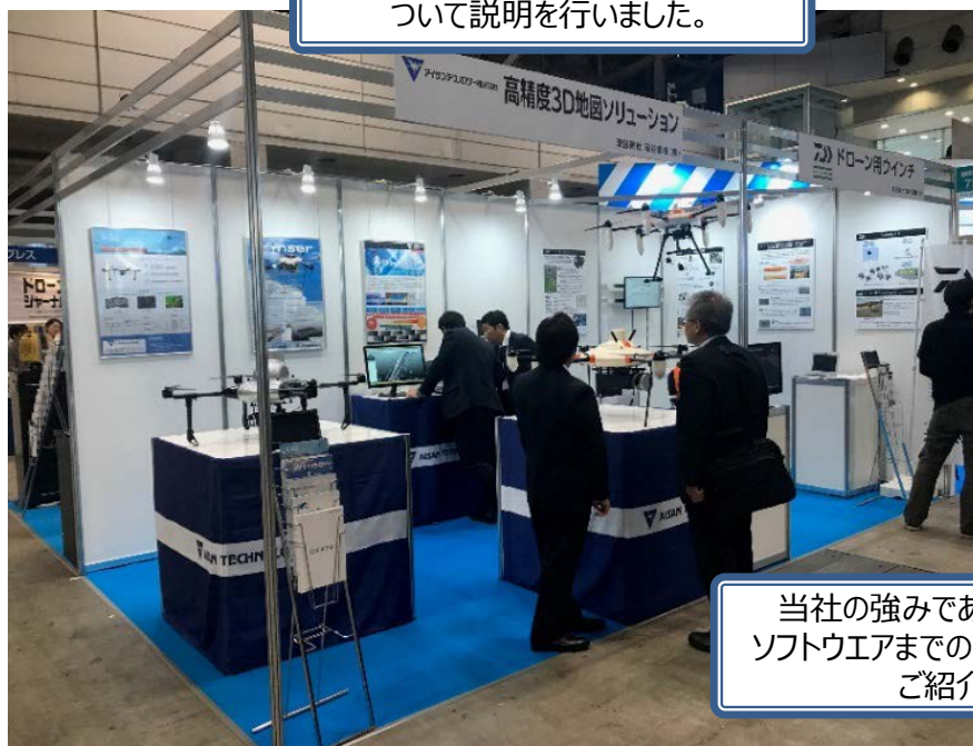
当社の強みである、ハードウェアからソフトウェアまでのトータルソリューションをご紹介しました。