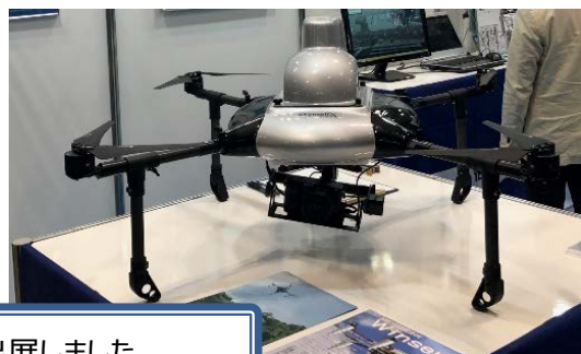
各種UAVを出展しました。